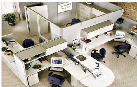
สำนักงาน