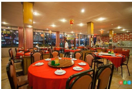
ภัตตาคาร