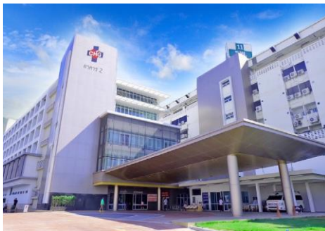
สถานพยาบาล