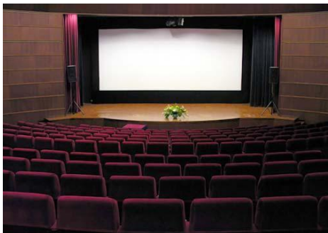
โรงมหรสพ