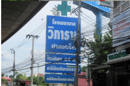
ตัวอย่างป้ายที่ต้องเสียภาษี

หากในกรณีที่ไม่มีผู้มายื่นแบบแสดงรายการภาษีป้าย หรือเจ้าหน้าที่ไม่สามารถติดต่อหรือหาเจ้าของป้ายได้ ให้ถือว่าผู้ครอบครองป้ายมีหน้าที่เสียภาษีป้าย แต่ถ้าหาตัวผู้ครอบครองป้ายไม่ได้ เจ้าของหรือผู้ครอบครองที่ดินที่ติดตั้งป้ายจะต้องเป็นผู้เสียภาษีป้ายแทน ตามลำดับที่กล่าวมา