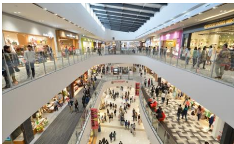
ห้างสรรพสินค้า