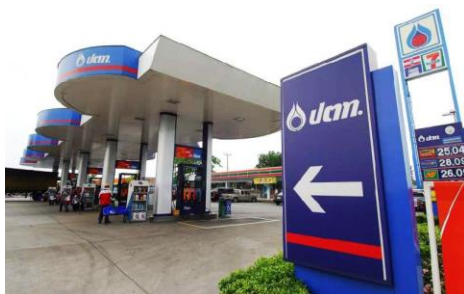
สถานีบริการน้ำมัน