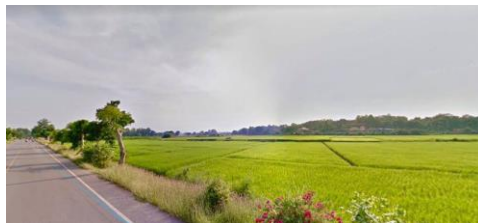
ที่ดินที่ใช้ทำเกษตรกรรม