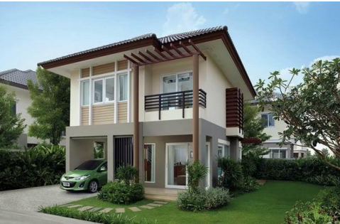
บ้านเดี่ยว