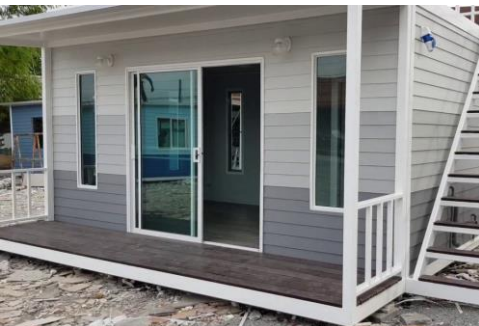
บ้านประกอบเสร็จ