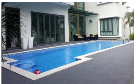
สระว่ายน้ำ