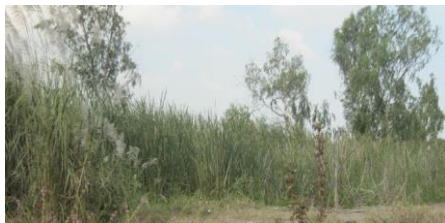
ที่ดินรกร้างไม่ได้ใช้ประโยชน์

(๒) ที่ดินที่ไม่เป็นกรรมสิทธิ์ของบุคคลธรรมดาหรือนิติบุคคล แต่อยู่ในความครอบครองของบุคคลธรรมดาหรือนิติบุคคล เช่น สปก. ๔, ก.ส.น., ส.ค.๑, นค.๑, นค.๓ ส.ท.ก.๑ ก, ส.ท.ก.๒ ก, นส.๒ (ใบจอง)และที่ดินอันเป็นทรัพย์สินของรัฐซึ่งมีการเข้าไปครอบครองหรือทำประโยชน์ ฯลฯ เป็นต้น