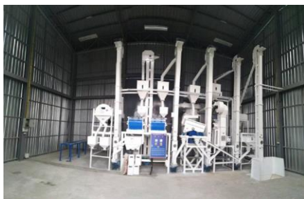
โรงสีข้าว