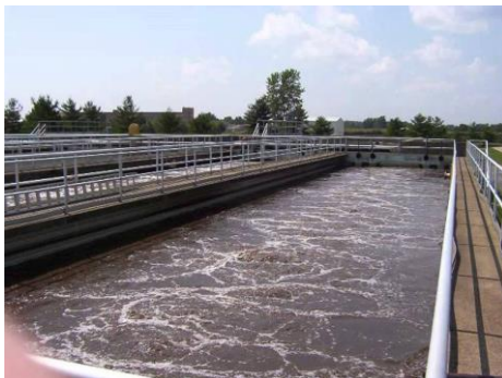
บ่อบำบัดน้ำเสีย