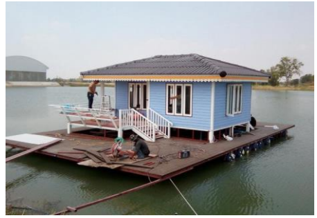
บ้านเรือนแพ