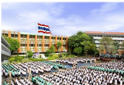
สถานศึกษา