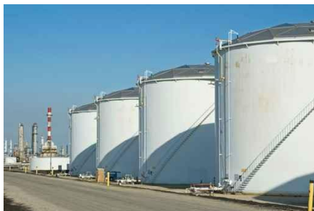
ถังเก็บน้ำมันบนดิน